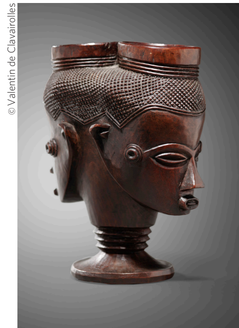
Coupe Kuba Janus, République Démocratique du Congo, bois, 18 cm, collection privée, Belgique.