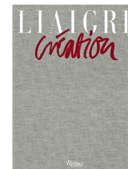
'Liaigre Création', Rizzoli, New York, 69,50 euros, www.rizzoliusa.com